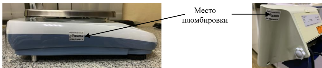
Рисунок 2 – Место пломбировки от несанкционированного доступа: разрушаемая наклейка.