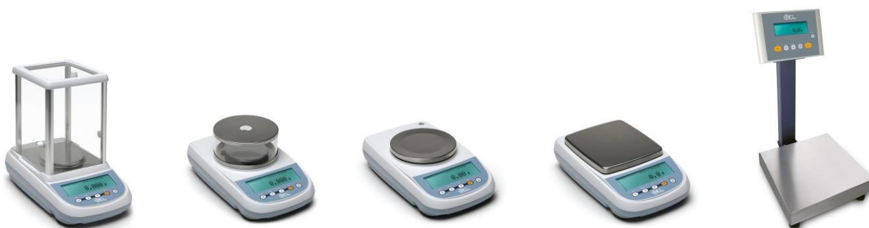
Схема пломбировки от несанкционированного доступа представлена на рисунке 2.

LGW203i LG203i LG2202 LG10001 LGW423i LG423i LG2202i LG20001