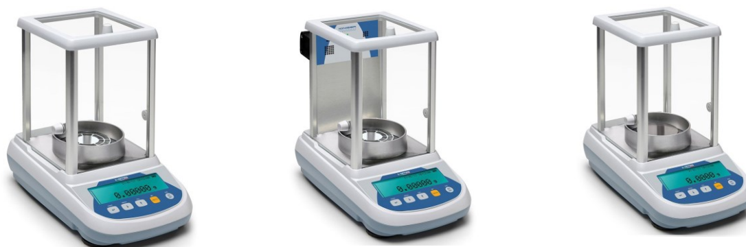
Рисунок 1 – Общий вид весов

Схема пломбировки от несанкционированного доступа представлена на рисунке 2.